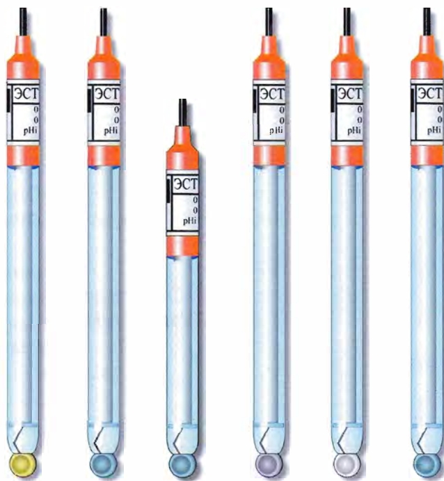
Рис.1. Фотография внешнего вида электродов стеклянных твердоконтактных ЭСТ.

Электрод является невосстанавливаемым однофункциональным изделием.